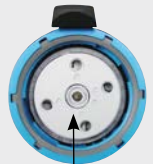
Cortinilla de seguridad

Con recubrimiento de estireno resistente al manejo rudo. Su forma y tamaño las hacen fácil de transportar por el área de trabajo. Utilizadas comúnmente en la construcción y plantas de agregados.